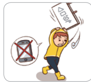
2 걷어가는 중에는 스마트폰 사용을 자제하고 주변을 경계